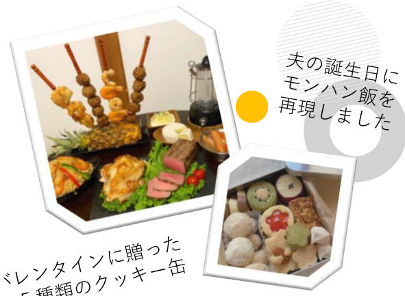
夫の誕生日にモンハン飯を再現しました