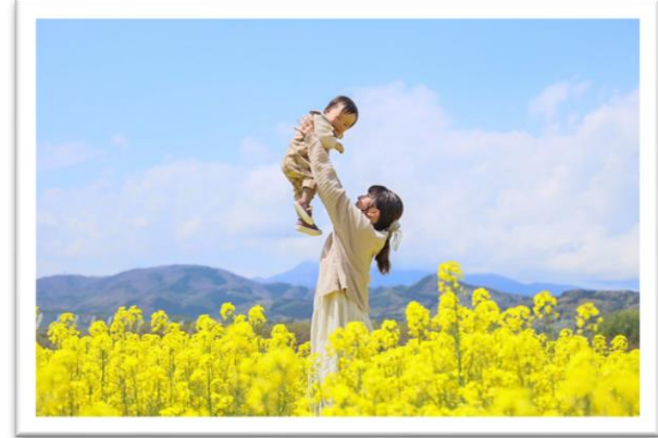
1歳半のやんちゃ息子がいます。