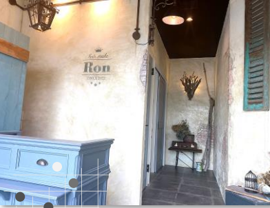
とてもお洒落な店内です