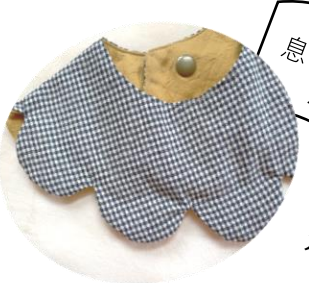
息子に作ったスタイ活躍中です！