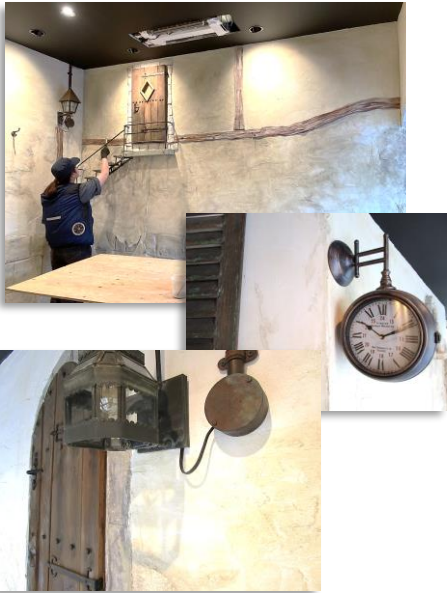
オーナーのセンスが光る 素敵な内装